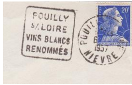
Exemple de Daguin avec une flamme texte de Pouilly-sur-Loire

16 bureaux de la Nièvre ont possédé des « Machines Daguin » dont 12 utilisèrent une « Flamme-Texte ».