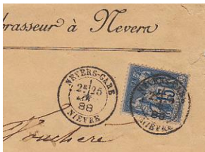
Daguin jumelé Nevers-gare